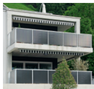
Geländer mit Photovoltaik-Elementen